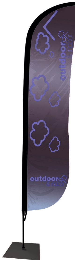
Forme goutte d'eau