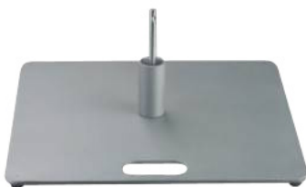
Embase métallique plate 8kg